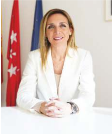
Candelaria Testa Romero Alcaldesa de Alcorcón

En abril celebramos el 40º aniversario de la aprobación de la Ley General de Sanidad impulsada por Ernest Lluch. Una base normativa que permitió hacer efectivo el derecho a la protección de la salud reconocido en el artículo número 43 de la Constitución Española.