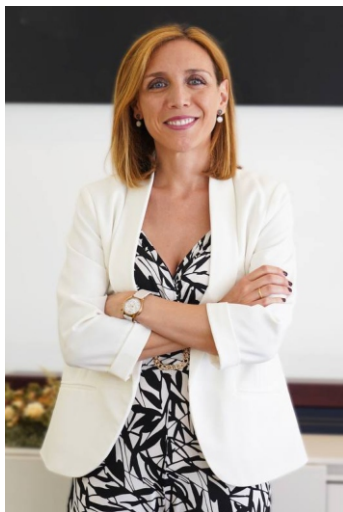
Candalaria Testa Romero Alcaldesa de Alcorcón

El Ayuntamiento de Alcorcón incluye entre sus principales líneas estratégicas: el bienestar integral de los niños, niñas y adolescentes —objetivos generales que guían todas las decisiones de nuestra administración.