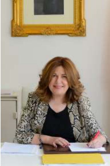
Natalia de Andrés Alcaldesa de Alcorcón

Si algo caracteriza a nuestra ciudad es la cultura, la participación y el arte, ya que Alcorcón es uno de los escenarios referentes de la expresión artística en la región, con importantes espacios que hacen efectivo nuestro objetivo de fomentar y facilitar el acceso a la cultura a toda la ciudadanía, con una oferta que atiende las necesidades, gustos y demandas de la población, así como diversificar la agenda cultural en los distintos barrios de la ciudad.