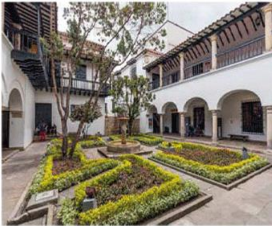
(Casa de la Moneda de Santa Fe)